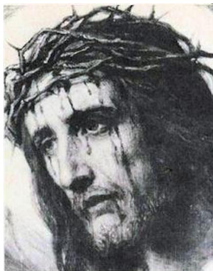
Isuse, ia suferința mea și fă cu ea precum voiești Tu.

Dacă aș cere mai multor suflete acest sacrificiu, poate le-ar fi teamă și M-ar refuza. Cu toate acestea, suferă multe suflete, care de fapt nu știu că și ele sunt suflete alese. Mulți copii ar putea întreba, de ce unii suferă iar alții nu? Răspunsul Meu este că Eu aleg acele inimi curate care sunt smerite în această viață și care pun necesitățile altora înaintea propriilor nevoi. Un suflet tandru preia rolul suferinței pentru Mine. Acesta este un dar de la Mine. Poate că nu vi se pare a fi un dar, însă când îl primiți, în numele Meu, salvați mii de suflete în fiecare zi. Acum aș face un apel către toți discipolii Mei să aducă zilnic câte o jertfă, asemănătoare suferinței, ca prin aceasta să ajute la salvarea sufletelor care mor în păcat de moarte la Marele Avertisment. Vă rog cereți-Mi acest dar. Cer sufletelor smerite să aducă jertfă personală pentru preamărirea Mea. Sufletelor, care simt că nu pot să facă asta, le spun, că vă Voi binecuvânta cu haruri speciale, deoarece știu că datorită iubirii pentru Mine și datorită rugăciunilor voastre salvați sufletele fraților voștri. 23 august 2011